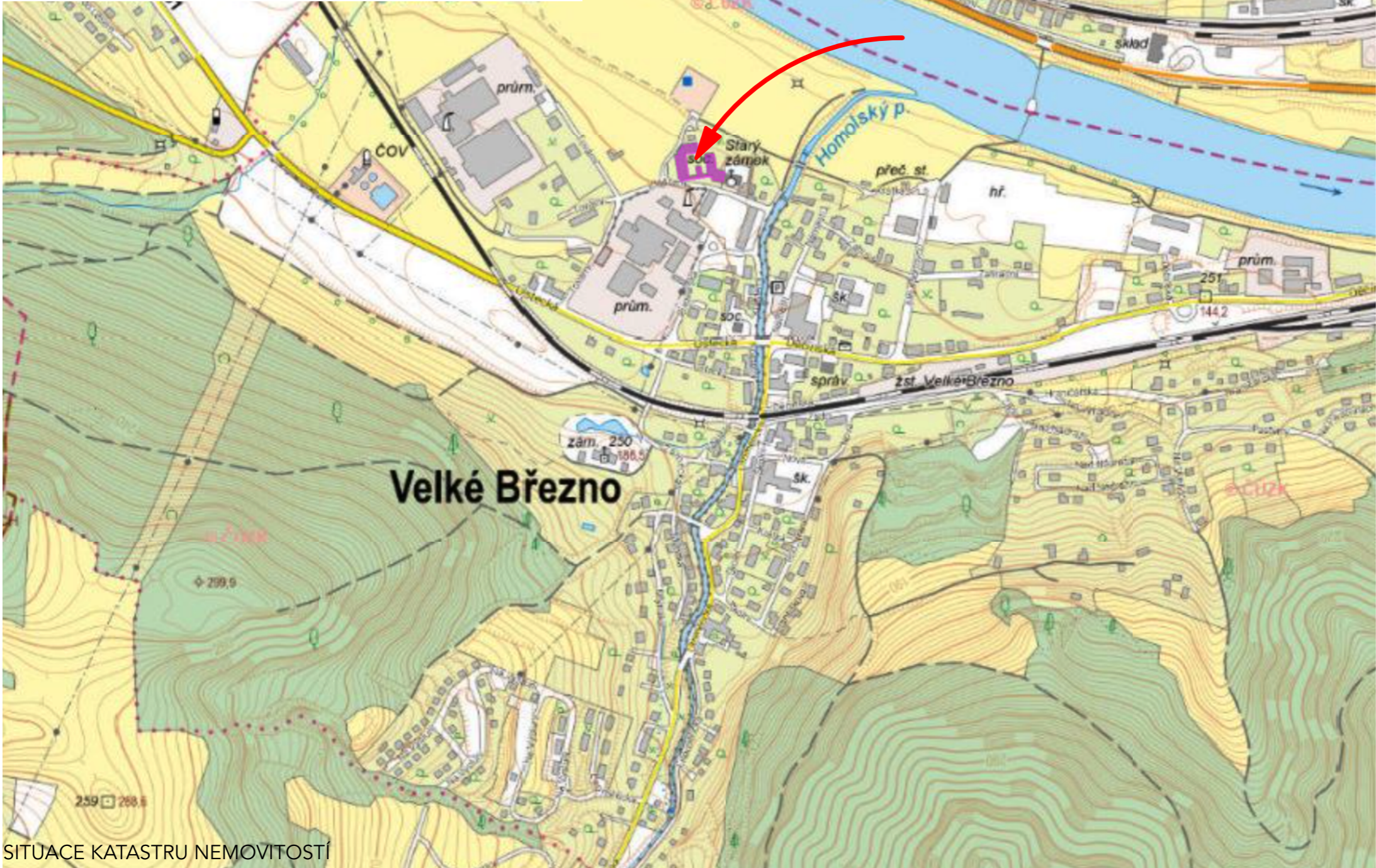
SITUACE KATASTRU NEMOVITOSTÍ